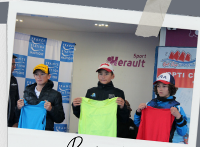
Remise des lycras